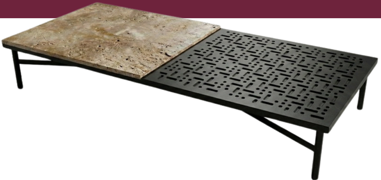
MESA DE CENTRO IRON STONE